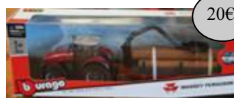
GAD27 BE TRACTEUR AVEC BENNE