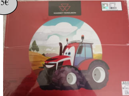
GAD18 PUZZLE 40 PIECES 2 ENSEMBLE ENFANT