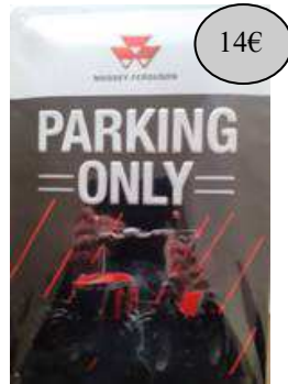
GAD16 PARKING ONLY FOND NOIR MF8 S 265