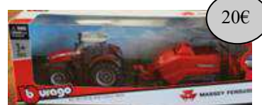
GAD27 RP TRACTEUR REMORQUE PRESSE