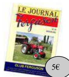
JOUR Journal du Club Spécifier le ou (Les) N° désiré(s) 1 à 52

Bon de commande ci-dessous à imprimer et à renvoyer avec le paiement A l'adresse mentionnée