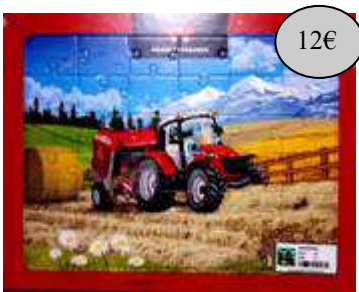
GAD18 PUZZLE 36 PIECES 2 ENSEMBLE ENFANT