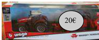
GAD27 BE TRACTEUR AVEC BENNE