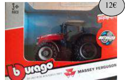
GAD17 TRACTEUR JOUET FRICTION MF 8740S