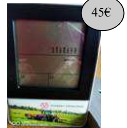
GAD46 STATION METEO MF