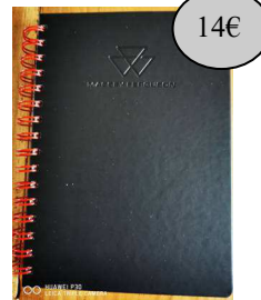
GAD45 CARNET DE NOTE A SPIRALE MF