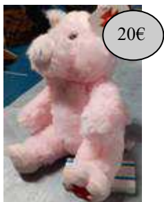
GAD24C COCHON ROSE PELUCHE MF