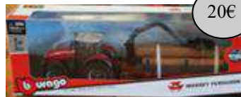
GAD27 RB TRACTEUR REMORQUE BOIS