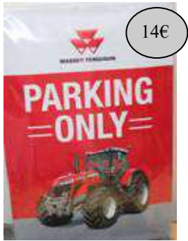
GAD15 PARKING ONLY FOND ROUGE MF8740