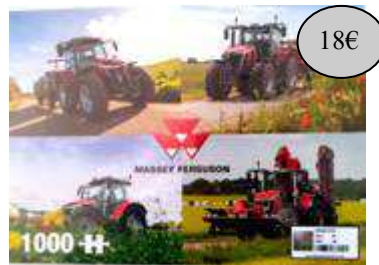
GAD23 PUZZLE 1000 PIECES