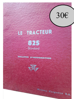
GAD 825 MASSEY FERGUSON Livret d'information Uniquement sur commande